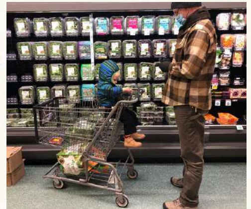
The Packer's Fresh Trends 2024 survey asked about packaged produce purchases.

Por origen étnico, Fresh Trends 2024 encontró que el 86% de los